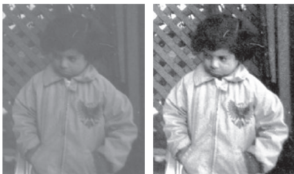
شکل ۱: الف) عکس اصلی ب) تصویر بهبود یافته با روش HE

مثالی از بهبود کنتراست تصویر با استفاده از روش متعادلسازی هیستوگرام در شکل (۱) نشان داده شده است.