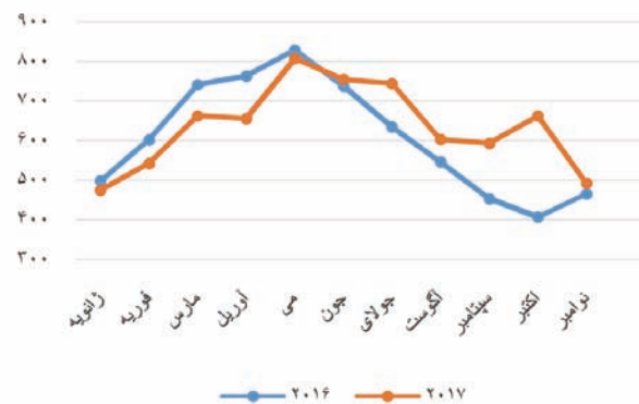
شکل ۴: مقایسه آمار تولید سال ۲۰۱۶ و ۲۰۱۷

در این مورد با مقایسه مقادیر تولید در سال ۲۰۱۶ و ۲۰۱۷ مشاهده می‌شود که انرژی تولید شده به میزان ۲۰۶ کیلووات ساعت افزایش داشته که این مساله به شرایط تابش و تعداد روزهای ابر و باران بستگی دارد.