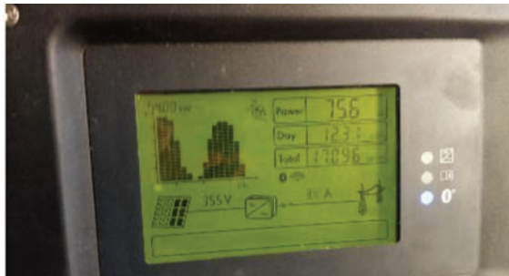
شکل ۱: اطلاعات تولید درج شده بر روی صفحه اینورتر سایت منصوبه

با مراجعه به نیروگاه منصوبه، مجموع تولید از زمان نصب تا لحظه اندازه‌گیری بر روی صفحه اینورتر نشان داده شده است. همان‌طور که از شکل (۱) مشاهده می‌شود، مقدار توان لحظه‌ای نیروگاه در زمان اندازه‌گیری ۷۵۶ وات، میزان انرژی تولیدی کل روز تا زمان اندازه‌گیری ۱۲/۳۱ کیلووات ساعت و میزان کل انرژی تولیدی از زمان راه‌اندازی نیروگاه تا زمان اندازه‌گیری ۱۷/۰۹۶ مگاوات ساعت می‌باشد.