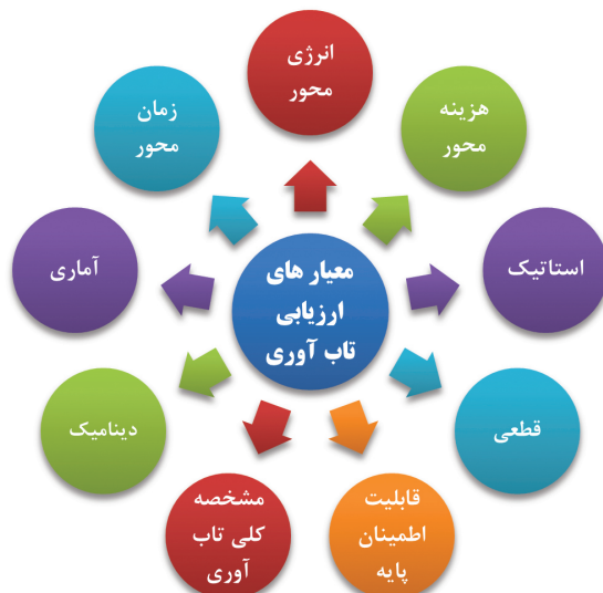
شکل ۳: معیارهای مختلف ارزیابی تاب‌آوری

کلی‌ترین دسته‌بندی بر اساس مشخصه‌های کلی تاب‌آوری یعنی