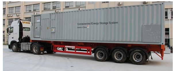
شکل ۴: یک سیستم ذخیره انرژی قابل حمل [۲۹]

بار با استفاده از منابع سیار ذخیره انرژی ارائه می‌کند. در این مدل با استفاده از دو راهبرد توزیع بهینه منابع سیار ذخیره انرژی و شکل‌دهی بهینه ریزش‌بکه‌ها در سطح سیستم توزیع، سعی در به بیشینه رساندن بارهای بازیابی شده پس از حادثه شدید می‌شود. نتایج شبیه‌سازی در این کار نشان می‌دهد که سیستم‌های ذخیره انرژی قابل حمل به طور قابل توجهی عملکرد بازیابی و تاب‌آوری سیستم را بهبود می‌بخشد.