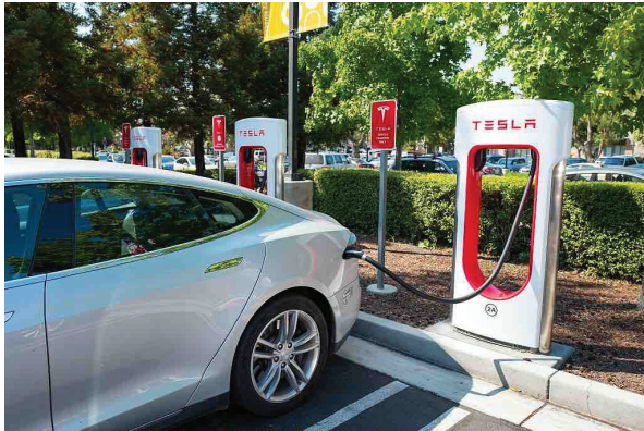
شکل ۴: یک خودروی الکتریکی شرکت تسلا در حال تبادل انرژی با شبکه (V2G) ۴-۲-۲- بازآرایی شبکه ۱۷

نیز می‌باشد، سبب کنترل بهتر اپراتورهای شبکه بر روند شارژ باتری‌های خودروهای الکتریکی شده و می‌تواند در بهره‌برداری بهینه شبکه‌های توزیع شامل خودروهای الکتریکی موثر باشد. نتایج بررسی‌های عددی مدل ارائه شده نشان می‌دهد که استفاده از ظرفیت خودروهای برقی و به خصوص ایستگاه‌های تعویض باتری می‌تواند تأثیر به‌سزایی در بهبود تاب‌آوری ریزش‌بکه‌ها داشته باشد.